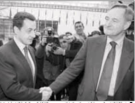
■ وزير المالية الفرنسي الجديد ساركوزي يصافح سلفه فرانسيس مير. بعد التشكيل الجديد للحكومة الفرنسية

المريض توجه إلى المدينة بحثاً عن مساعدة طبية. وقالت الدعية العامة لحكمة الجزاء الدولية كارلاديل بوتني ان الحلف الاطلسي كاد ان يعقله لكنه فشل في اللحظة الاخيرة وأضاف ان كرايجيتش كان هناك لساعات إلا ان قوة احوال الاستقرار وصلت متأخرة ساعتين. وشنت القوة في ٢٨ فبراير الأول من مارس ٢٠٠٢ عملية جديدة في محاولة لاعتقاله .. بات بالفشل. وكان كرايجيتش تعهد في ١٩ يوليو ١٩٩٦م تحت ضغط الاسرة الدولية بوقف كل نشاطاته العامة لكنه واصل سرا لعب دور حتى انتصار خصومه المعتدلين في الانتخابات التشريعية في ١٩٩٧م. واعلن كرايجيتش في تلك السنة أنه مستعد للمثول أمام محكمة صربية بأشرف محكمة الجزاء الدولية .. لكنه اختلف من مقر اقامته في بالي بعيد هذا الاعلان . ومنذ ذلك الحين تصدر شائعات متضاربة عن وجوده من حين لآخر .. مما يسهم في التشويش على عملية مطاردته . وقد تحدثت صحف اليوسنة وكروانا عن وجوده في فوئشا وفيسغراد ومونتينيغرو وبلغراد بينما ذكرت صحيفة بوسنية في سبتمبر ٢٠٠٠م أنه شوهد في واحدة من ضواحي ساراييفو. واكدت كارلاديل بوتني في فبراير الماضي وجوده في بلغراد وهي معلومات لم تؤكدها السلطات الصربية. وجررت عمليات أخرى وخصوصاً في أغسطس ٢٠٠٢م في بالي للقضاء على شبكات تدعم كرايجيتش. وفي الإطار نفسه .. جمعت الاسرة الدولية الحسابات المصرفية لعشرات الاشخاص بينهم شقيقه وابنه وابنته وزوجته التي كانت في حديث لصحيفة يوتارني ليست الكرواتية في يناير الماضي انها لم تلتق أي معلومات عن زوجها منذ سنتين. وقالت ان الذين يراقبوننا بشكل متواصل يعرفون جيداً انني لم اجر اي اتصالات مع رادوفان منذ أكثر من سنتين.