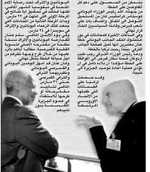
وقد حصلت تركيا على الضمانات التي طلبتها من الاتحاد الأوروبي المرتبطة