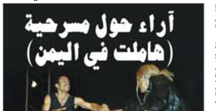
أراء حول مسرحية «هاملت في اليمن»