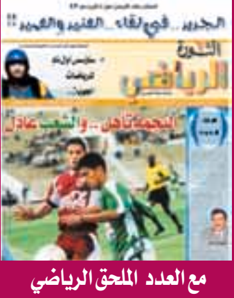
مع العدد الملحق الرياضي

■.. طهران وكالات الأنباء.. نفى رئيس مجمع تشخيص مصلحة النظام في إيران علي أكبر هاشمي رفسنجاني أمس ان تكون لديه النية في الوقت الحاضر للترشح في الانتخابات الرئاسية المقبلة في بلاده ٠٠ مشيراً إلى أنه يجب إفساح المجال أمام الطائفت الشابة والخلاقة لدخول الميدان. ونقلت وكالة الأنباء الإيرانية عن رفسنجاني قوله انه لا يرى في الوقت الحاضر ما يحمله على الترشح للانتخابات الرئاسية ٠٠ مشدداً على وجوب دعم الطاقات الشابة وتشجيعها لملء الساحة السياسية. وكانت آباء البناء صحيفة محلية قد أشارت إلى اتفاق بين حزب كوراد البناء الذي يرعاه رفسنجاني وحزب جيبهة المشاركة الاصلاحى برئاسة محمد رضا خاتمي على دعم الرئيس الإيراني السابق هاشمي رفسنجاني في الانتخابات الرئاسية المقبلة.