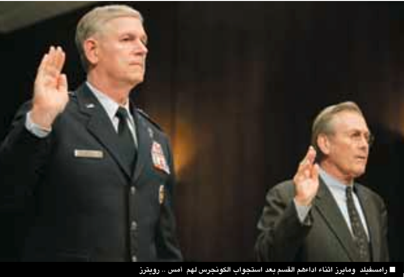
رامسفيلد ومايرز أثناء اداعهم القسم بعد استجواب الكونجرس لهم

وتابعت : إن الغزى من هذا واضح، مشيرة إلى أن دونالد رامسفيلد يجب أن يستقيل، وإن لم يفعل فعلى بوش أن يقله.