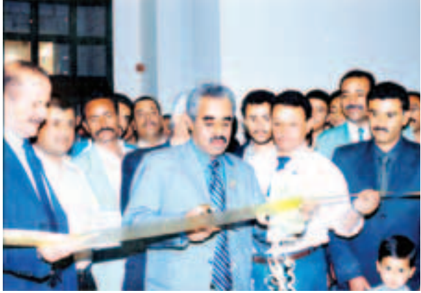
في جامعة صنعاء