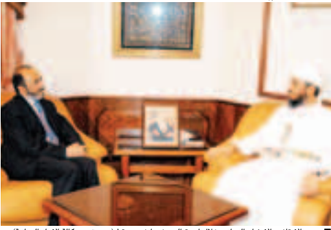
■ وزير الأوقاف والإرشاد العماني خلال استقباله سفيرنا في صنعاء.