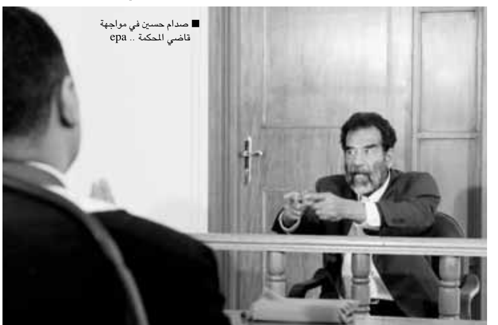
صدام حسين في مواجهة قاضي المحكمة