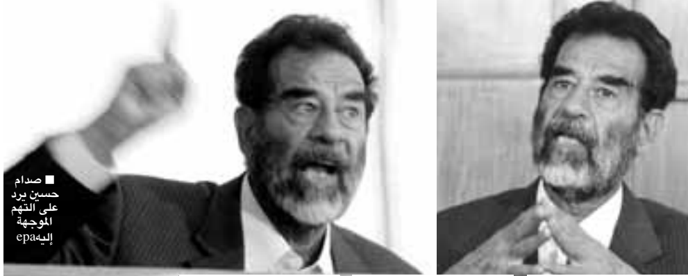
صدام حسين يرد على التهم الموجهة إليه epa

لكنه شدد على تصميم هيئة الدفاع على الذهاب إلى العراق وأضاف الغزاوي سنا سفر على مسؤوليتنا.