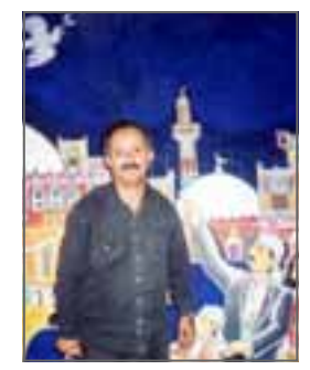
□ مظهر زرار