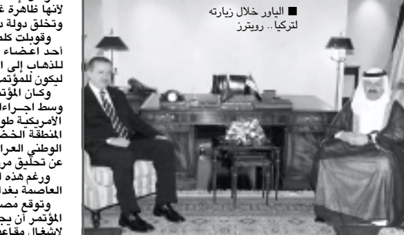
الياور خلال زيارته لتركيا.. رويترز

وقال الرئيس التركي أحمد نجتد سيزر خلال مؤتمر صحافي في ختام مباحثات مع نظيره العراقي قلت للرئيس الياور : إننا نتوقع من السلطات العراقية وضع حد للكوتورنج جيل في العراق كي لا تصير البلاد مرتعاً للمنظمات الارهابية. ومن جهته أوضح الياور : إنه لا يمكننا تجاهل تنظيم بشكل خطراً على امن جيراننا .. مؤكداً رغبة بلاده في تطوير العلاقات مع تركيا ضمن إطار علاقات حسن الجوار من دون التدخل في الامور الداخلية. إلى ذلك اعرب الرئيس التركي بشكل غير مباشر عن قلقه إزاء سيطرة الاكراد العراقيين على مدينة كركوك الواقعة في منطقة غنية بالنفط. وتابع سيزر : قلت للرئيس الياور : إن محاولات اي مجموعة اتنية تعينش في كركوك اكانت تركمانية او عربية او كردية او اشورية او غيرها للمخاطبة بالسيطرة على المدينة قد تضع امن واستقرار العراق في خطر.