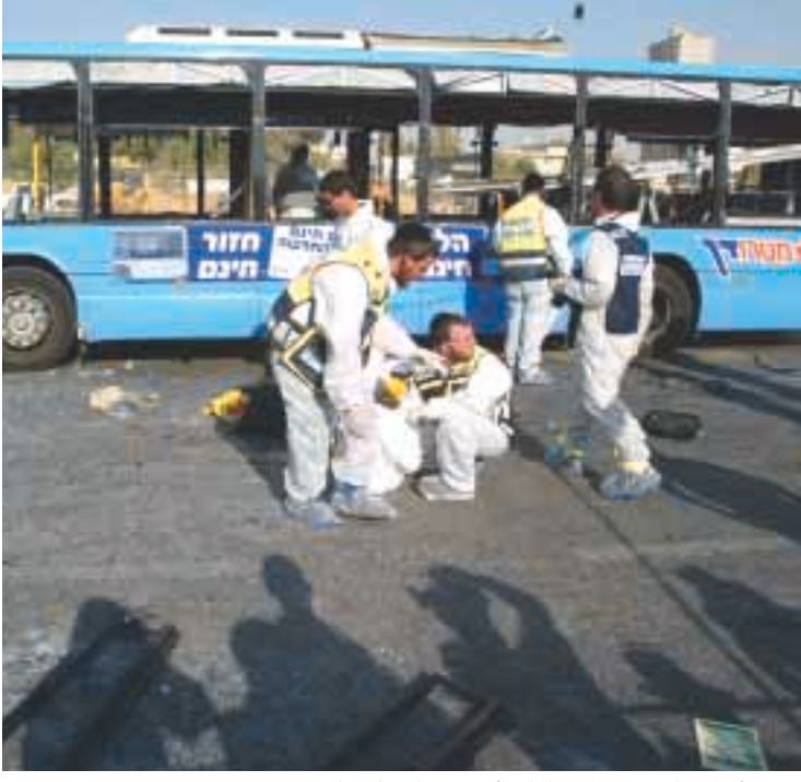
خبراء اسراييليين في موقع إحدى العليتين أمس في بيت السبع