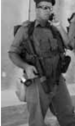
جنود إسرائيليين امام الجدار العنصري بالضفة أمس...

وأوضح قراقع إن الاضراب عن الطعام الذي شارك فيه في الفترة الأولى نحو نصف المعتقلين الفلسطينيين الخمسينيات إلا في السجون الإسرائيلية. ولا يزال ينفذه ٦٠٠ أسير في سجن بشر السبع في جنوب إسرائيل. وأكد قراقع باسم إدارة السجون الإسرائيلية بأن دومينيس لوكالة الصحافة الفرنسية وحدهم الاسرى في سجن السبع يواصلون الاضراب عن الطعام. ونفى أن تكون إدارة السجون وافقت على تلبية مطالب المعتقلين. وأوضح لم تقدم أي تنازلات. لقد اتركوا فقط أنهم لن يحصلوا على شيء من خلال الاضراب. وبطالب المعتقلون خصوصاً بإزالة الزجاج الفاصل خلال زيارة نزيهم وزوارهم ووقف التفتيش الجسدي المهين والمعاقبة بوضع المعتقلين في زنانات ضيقة جداً. وبطالبون أيضاً بوضع هواتف عامة في تصرف المعتقلين. وترافق الاضراب مع تظاهرات تضامناً في صفوف السكان الفلسطينيين ونقذ اضراب تجاري أمس في قطاع غزة دعمًا للمعتقلين.