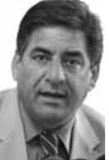
السجون الإسرائيلية علقوا اضرابا عن الطعام بأشهره في ١٥ أغسطس ولا يزال ٦٠٠ بينهم يواصلونه.

وقال عيسى قراقع رئيس نادي الاسير الفلسطيني المنظمة الفلسطينية الرئيسية المدافعة عن حقوق المعتقلين ٨٤٠