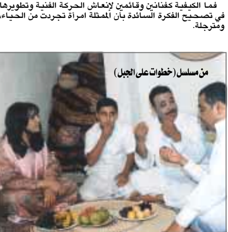
من سمسلة (خطوات على الجبل)

في استقراء سريع لاستبيان فني لفئات الثانوية والجامعة عن مدى مشاركتهن في مجال التمثيل إذا مارشدن للعمل فيه اتى الرد تلقائاً ويعقوبة من ضمن للمرأة أن تكون إنسانة وليست سلعة في سوق الفن والشهرة.. فما الكيفية فنانين وقائمى لإنعاش الحركة الفنية وتطويرها في تصحيح الفكرة السائدة بأن الممثلة امرأة تجردت من الحياء، ومترجلة..