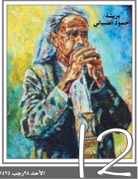
بريشة / حمود الضبياني

وتزامناً مع صنعاء عاصمة للثقافة العربية 2004م وضمن برنامجها الثقافي السنوي يقم النادي الأهلي الرياضي الثقافي بصنعاء في الثامنة من مساء غد الاثنين محاضرة وأمسية فنية حيث يلقي البروفيسور جان لامبيرت محاضرة قصيرة بعنوان «الموسيقى اليمنية من وجهة نظر باحث فرنسي» ثم يقدم العازف الأميركي من أصل سوري «لث علي» بعضاً من المعزوفات العالمية على آلة البرق علماً أنه يحمل درجة الماجستير في موسيقى الشعوب. ethno- Musicology من جامعة