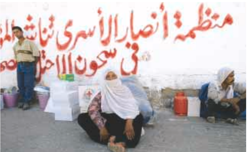
عائلات فلسطينية تتسلم مواد الإغاثة أمس بغزة

عبد الخبيس 20 24 صحة صحة بومبة سياسية نقابة جامعة تأسست عام ١٩٧٧