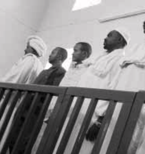
المتهمون بالمحاولة الانقلابية خلال محاكمة أسام الخزوم أمس