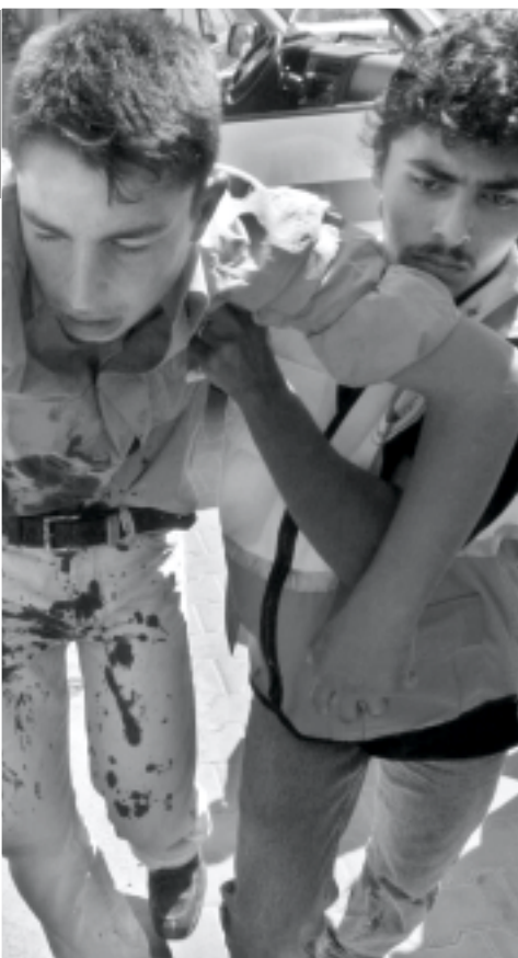
شباب فلسطيني يقوم بنقل أحد الجرحى بجرحى جباليا أمس

اسديروت الاستطانية في التقب الغربي بأنه حادث خطير جداً لاتخاذ جميع الطوائف التي تتكفل وضع حد لاطلاق صواريخ القسام ومواجهة الموقف في قطاع غزة. وكان الجنرال موشيه كوايدي المقتش العام للشريعة الاسرائيلية قد وأصدر تعليماته بتعزيز قوات الشرطة في مدينة سدديروت وذلك لتقوية شعور الأمان لدى المستوطنين بعد اطلاق صواريخ القسام وسقوط قتيلين وجرح عشرين آخرين حيث ساد شعور الاحتياط لدى المستوطنين وطالبوا بإرسال اطباء نفسيين لتهدئة أوضاع المستوطنين المضطربة جراء استمرار قصف صواريخ القسام بالرغم من الحشودات العسكرية الكبيرة في شمال القطاع. وفي نيويورك أكد عبدالله احمد بدوي رئيس الوزراء الماليزي أن على حركة عدم الانحياز مؤسسه يعاون رئيس الشعب الفلسطيني للحصول على وطن خاص به وانقاذ خارطة الطريق للسلام في الشرق الأوسط. جاء ذلك في خطاب لرئيس