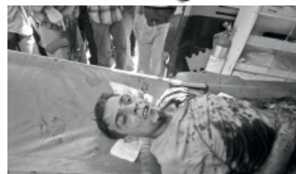
■ أحد شهداء غزة أمس

وأقر بيان النزاع بين إسرائيل والفلسطينيين يشبه أكثر فاكتر حرباً مسلحة وتحدث في بعض الجوانب عن الوضع الذي كان سائداً في لبنان خلال الاحتلال الإسرائيلي لجنوب البلاد الذي