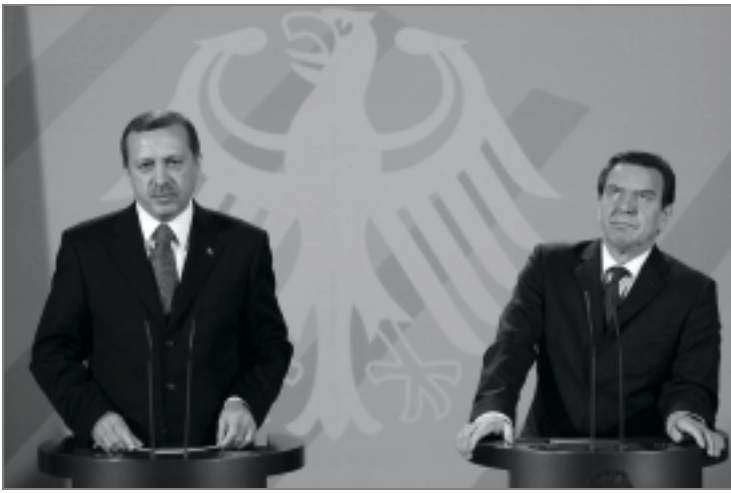
■ المستشار الألماني ورئيس الوزراء تركيا في مؤتمر صحفي.

وتابع: إن عالما المعاصر هو احوج ما يكون إلى السلام والتعايش والعدالة والديمقراطية سواء على الصعيد الوطني أو الدولي.