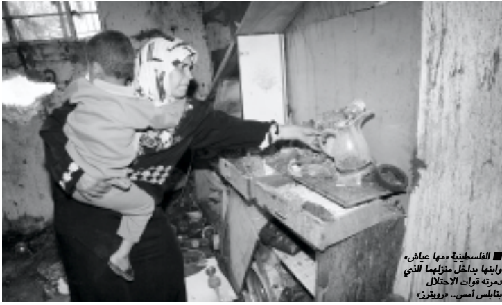
الغالبية معها يعيش، وانها بدائل لمؤامراتها التي دبرتها قوات الاحتلال، بتأييد امس، - زوريزور