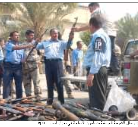
بعض من رجال الشرطة العراقية يتسلمون الأسلحة في بغداد امس .. cpa

وإلى انسحاب حلفاء يمينيين من الائتلاف بسبب خطة الانسحاب إلى تجريد شارون من أغلبيته ويهدد شريكة القومي الوحيد المتبقى بالانسحاب قريبا. وقالت وسائل إعلام اسرائيلية