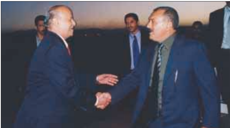
الرئيس اثناء وصوله إلى نبروبي..