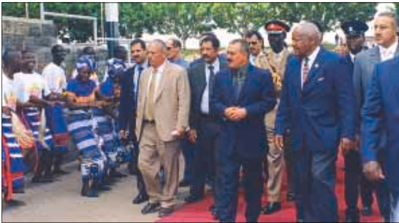
الثناء، دخوله قاعة احتفال التنصيب..

صاحب الفخامة الأخ الرئيس علي عبدالله صالح رئيس الجمهورية اليمنية السلام عليكم ورحمة الله وبركاته ٠٠ فإنه يسرني بمناسبة حلول شهر رمضان المبارك أن أعرب لفخامتك من أصدق التهاني القلبية وأطيب التمنيات الودية بموفقو الصحة والسعادة لفخامتك وباضطراد التقدم والأزدهار لشعبكم الشقيق وأن يجعل هذا الشهر الفضيل مقرون بالخير والبركة على شعوب الأمة الإسلامية .