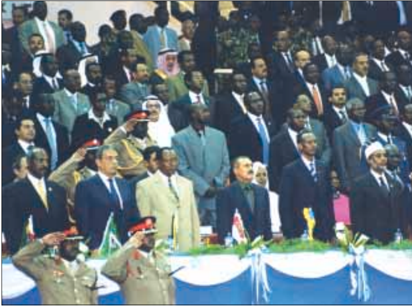
عاد الى صنعاء بعد مشاركته الفاعلة في تنصيب الرئيس الصومالي المنتخب عبد الله يوسف