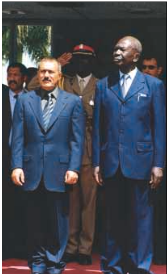
الرئيس اثناء وصوله إلى نبروبي..