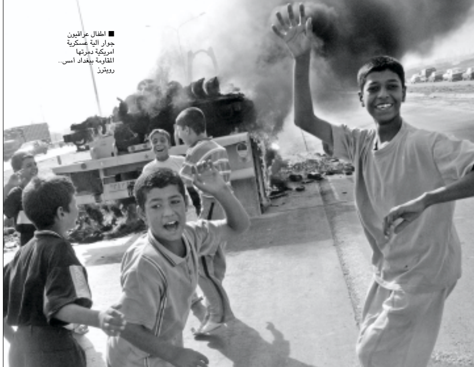
اطفال عراقيون جوار اية عسكرية امريكية بوزنها القاموفة ببغداد امس.

واضاف البيان «ندعو كل المجاهدين في مدن العراق إلى قطع الامدادات عن الامريكيين اذا حاصروا الفلوجة.. كما ندعومهم من الان الى قطع الامدادات عن القوات المهاجمة لهيت واللطيفيه والمحمودية واليوسفية واي مدينة تتعرض للهجوم». وفي تطور لاحق أكد احد اعضاء وفد الفلوجة الى المحادثات مع السلطات العراقية امس تعليق اي مفاوضات، مع الحكومة «الهزيلة» احتجاجاً على تصريحات اباد علاوي.