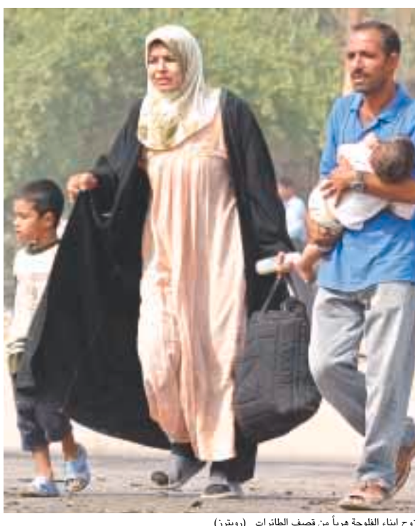
نزوح أبناء الفلوجة هرباً من قصف الطائرات