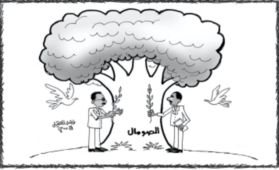
واشنطن وأوروبا تراقبان تشكيل حكومة كرامي