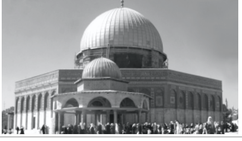
العام وتبدأ أعمال التشييد العام القادم.

■ بغداد/ العراق/ أ ف ب / شدد منظمو الانتخابات العراقية المقرر إجراؤها في يناير المقبل على اللأمم المتحدة على ضرورة توفير الدعم اللوجستي والتمويلي في عملية وصول المزيد من خبراء الأمم المتحدة والمستشارين الأجانب على الرغم من المخاطر الأمنية الكبيرة. وقال كارلوس فالينزويلا رئيس فريق الأمم المتحدة الذي اوكلت إليه مهمة إسداء التصانح اللفوقضية العليا المستقلة للانتخابات ان الأمم المتحدة وافسقت على إرسال ٢٥ مستشارا إضافيا وأن بريطانيا وعدت بإرسال مستشارين أو ثلاثة وذلك الاتحاد الأوروبي. ويشار إلى أن عدد كوادر الأمم المتحدة في العراق حاليا يبلغ ٣٥ شخصا وهو رقم أقل بكثير من رقم ٢٥٠ المتوقع للمساعدة في عمل مراكز الاقتراع. وقاتي تصريحات مسؤول الأمم المتحدة بعد أيام من انتقادات وجهها وزير خارجية الحكومة العراقية المؤقتة هوشيار زبيري حيال عدم قيام الأمم المتحدة بالدور الكافي في