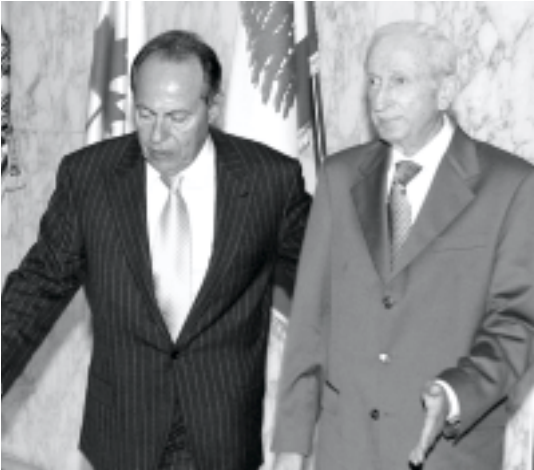
نشرت أمس في بيروت ان واشنطن تطالب دمشق بتدابير ملموسة تدل على تغير موقفها في لبنان والعراق ومسألة الارهاب. وأضاف «إذا لم يجرز تقدم في

معالجة هذه الأمور سيكون هناك حتماً تدهور مستمر في علاقتنا الثنائية ولدى الرئيس (الأمريكي) طائفة عريضة من الإجراءات التي يمكن اتخاذها تؤثر أكثر على العلاقات الاقتصادية والمالية والتجارية بين البلدين.. وكان ساترفيلد يشير إلى العقوبات التي اعتمدها الكونغرس الأمريكي والتي بدأت واشنطن بتطبيق جزء منها منذ مايو. وتابع المسئول الأمريكي «نحن قلقون جدا من الوضع يجب أن يكون لبنان وقياداته السياسية حرا من أي تدخل وأي تهديد وهذا القلق يشاظرنا إياه المجتمع الدولي وقد تم التعبير عنه في القرار ١٥٥٩ وبالبيان الأخير الصادر عن رئاسة مجلس الأمن».