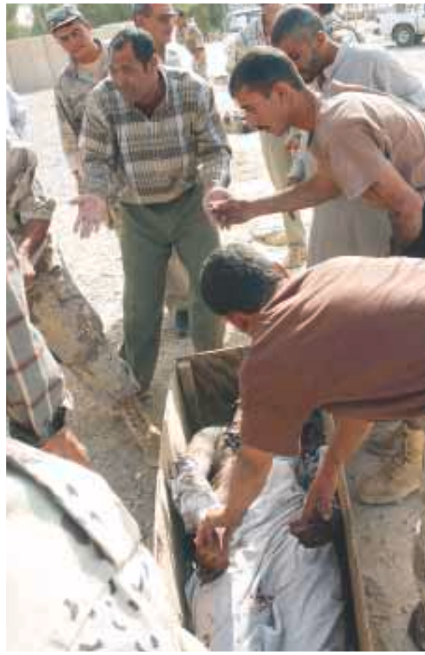
أفراد من الحرس الوطني العراقي يحملون أحد زملائه الذي اعتمه جماعة الزقواي أس