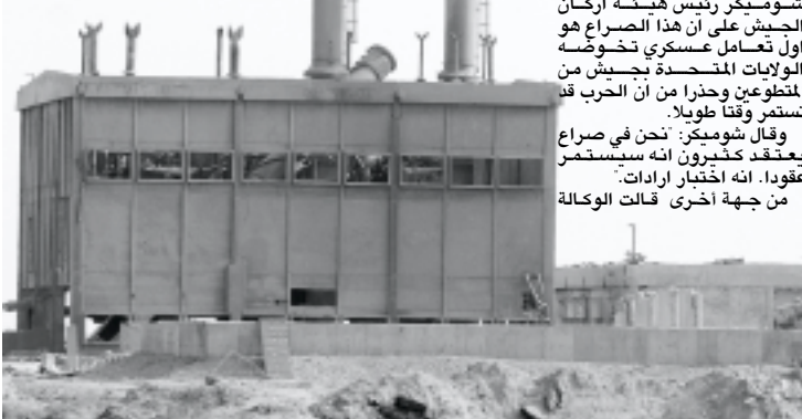
صورة حديثة لقاعدة القمع جنوب بغداد

وقال كيري امام انصاره في دوفر بنينهايمشير: هذا احد الاخطاء الفادحة الكبرى في العراق ومن بين افدح اخطاء هذه الإدارة وقد عرض عدم الكفاءة التي لا يمكن تصورها لهذا الرئيس جنودنا للخطر وعرض هذا البلد لخطر اكبر.