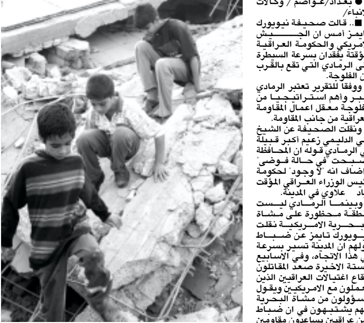
اطفال عراقيين فوق اثار منزل دمره القصف الأمريكي بالفلوجة أمس

وقال المتحدث : سيكون مجرد تكهات القول اذا كان ذلك سيحصل قبل الانتخابات أو بعدها . فاي اتفاق داخل الحلف سيكون أساسه الاجماع وقد يستغرق هذا وقتاً .