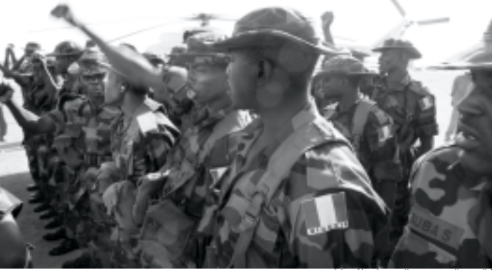
الجنود النيجيريون حال وصولهم لأبوجا أمس.. رويترز

وأوضح أن عثمانان جاءا ليشكر الحكومة النيجيرية لما تبذله من جهود من أجل تسوية الأزمة