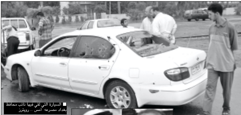
السيارة التي لقي فيها نائب محافظ بغداد مصرعه أمس

وعشر في بغداد السبت على رأس وحدة كودا في نهاية يوم شهد سقوط اضعف عدد من القتلى لتكبد القوات العراقية في العراق خلال يوم واحد منذ نحو أشهر وأعنف هجوم على منطقة اعلامية منذ اندلاع الحرب.