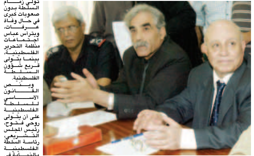
■ الفصائل الفلسطينية في اجتماعات متواصلة.

ويُنصق القناصون الأساسيين للسلطة الفلسطينية على أن يتولى روجي فتوح، رئيس المجلس التشريعي، رئاسة السلطة الفلسطينية بالنيابة في