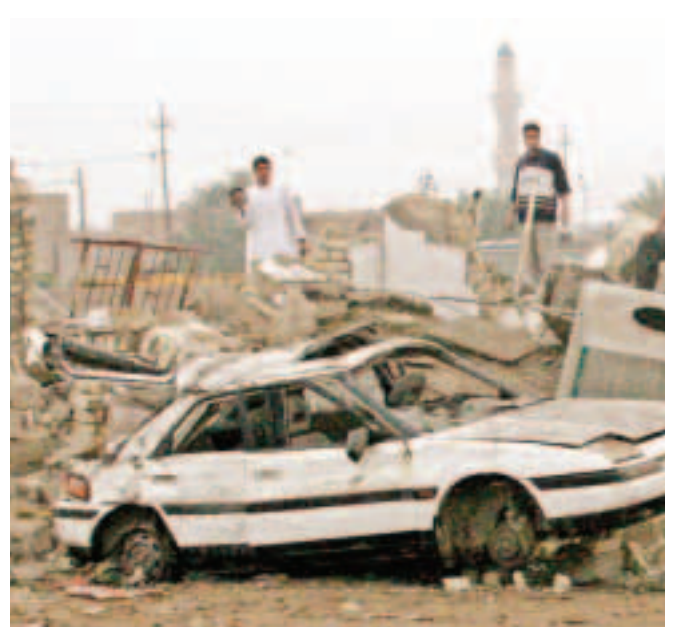
■ عراقيون واقفون على اطلال مستشفى في الفلوجة دمر اثر طلعات جوية امريكية.

وفي نيويورك افادت مصادر دبلوماسية في الأمم المتحدة ان أمين عام المنظمة الدولية كوفي امان حذر في رسائل وجهها إلى الولايات المتحدة وبريطانيا والعراق من الانكاسات السلبية على سير الانتخابات المقررة في يناير المقبل لاي هجوم عسكري على الفلوجة.