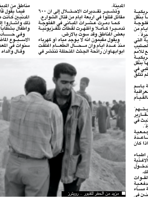
مزيد من الحفر للقبور

مناطق من المدينة. فيما يقول قادة امريكوي ان الاصابات بين المدنيين كانت ضئيلة لكن سكانا شكوا في ذلك واشاروا الى جوات قتل فيها نساء واطفال بشقايا او اصابتهم قنابل. وفي حادث وقع في وقت سابق من الاسبوع الامضى اصيب طفل سابع تسع سنوات في المعدة بشظية. وقال والداه انها لم يتمكنا من نقله الى