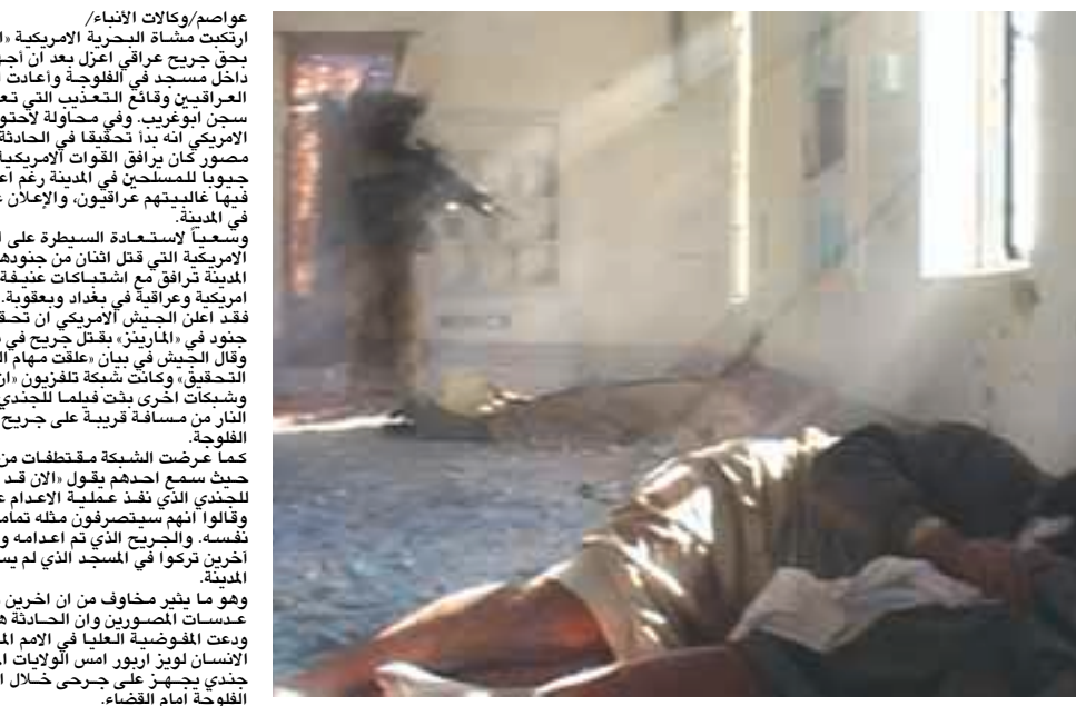
جندي أمريكي يجيز على جريح عراقي وهي الحادثة التي أثارت الرأي العام العالمي

عواصم/وكالات الأنباء/ ارتكبت مشاة البحرية الأمريكية «المارينز» جريمة حرب بحق جريح عراقي اعزل بعد ان اجهد عليه أحد جنودها داخل مسجده في الضلوجة واعادت الفضيحة الى أذهان العراقيين وقائع التعذيب التي تعرض لها الأسرى في سجن أبوغريب، وفي محاولة لاحتواء الأزمة قال الجيش الأمريكي ان هذا تحقيقاً في الحادثة التي سجلتها عسة منصور كان يرافق القوات الأمريكية التي لا تزال تصارع جنوباً للمسلحين في المدينة رغم اعتقال ١٠٥٢ شخصاً فغالبها بملابسهم عراقيون، والإعلان عن مقتل ١٦٠٠ مقاتل في المدينة.