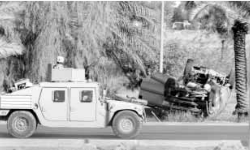
■ دبابة أمريكية تمر بجانب سيارة محطمة أمس في ضواحي بغداد...

وقالت مصادر أمنية في قطاع غزة إن دبابة إسرائيلية أطلقت قذيفة صاروخية باتجاه دبابة فلسطينية في قطاع غزة.