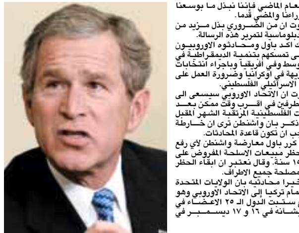
حصلت العام الماضي فائتا نيزل ما بوسعنا لوضعها ورامنا والمضي قدما . ورأي بوت ان من الضروري بذل مزيد من الجهود الدبلوماسية لتعزير هذه الرسالة. الى ذلك أكد باول ومحادثوه الاوروبيون مجددا على تمسكهم بتخيم الديمقراطية في الشرق الاوسط وفي أفريقيا واجرء انتخابات رئاسية نزيهة في أوكرانيا وضرورة العمل على حل النزاع الإسرائيلي الفلسطيني. واكد بوت ان الاتحاد الاوروبي سيسعى الى جمع الطرفين في اقرب وقت ممكن بعد الانتخابات الفلسطينية المرتقبة الشهر المقبل لكن باول ذكر بان واشنطن ترى ان خارطة الطريق يجب ان تكون قاعدة للمحادثات. الى ذلك كبر باول معارضة واشنطن لأي رفع محتمل لحظر مبيعات الاسلحة الامريكية لباكستان. وقال تعتبر ان ابقاء الحظر يجب ان يصب في مصلحة جمع الأطراف. وذكر اخيرا محادثة بان الولايات المتحدة تؤيد انضمام تركيا إلى الاتحاد الاوروبي وهو موضوع ستنته الدول ال ٢٥ الاعضاء في ١٦ و ١٧ ديسمبر في بروكسل.

مسؤولي حلف شمال الاطلسي والاتحاد الاوروبي في ٢٢ فبراير المقبل في بروكسل في اطار زيارة الى أوروبا تهدف على حد قول باول الى توطيد الروابط التي تضررت خصوصا بسبب الحرب على العراق. وقال باول الجمعة اعتقد ان هذه التصدعات قد التئمت وامل ان تكون زيارتي الى هنا هذا الاسبوع قد اسهمت في ذلك وهذا سيتحسن اكثر بدون اي شك عندما سيأتي الرئيس بوش الذي يثبته التزامه لجهة العلاقات بين صفتي الاطلسي. وفي بروكسل انتقد باول ستة اعضاء في الحلف الاطلسي يعارضون التدخل في العراق معتبرا انهم يضررون بمصداقية وتماسك الحلف عبر رفضهم المشاركة في برنامج لتدريب ضباط عراقيين. لكنه شد في الوقت نفسه على ان لقاءاته اثبتت التزام الولايات المتحدة في اعادة العلاقات الطيبة مع الأوروبيين. وقال ايضا اعتقد ان هذا الاسبوع تكلل بالنجاح واننا اظهرنا ان الولايات المتحدة متمسكة تماما بكل علاقاتها عبر الاطلسي.. وبالنسبة للمشكلات والخلافات الكبيرة التي