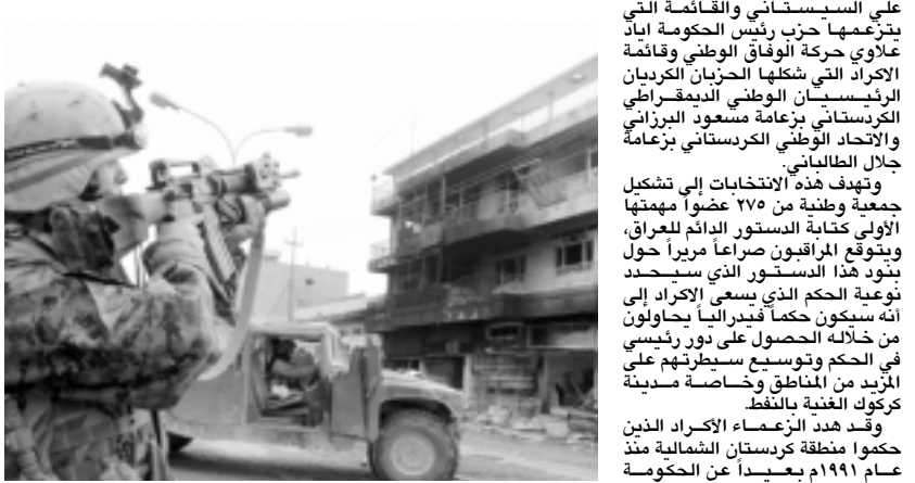
امريكي من جنود المارينز يصبو بندقيته نحو احدى الوحدات السكنية في الفلوجة.

■ بغداد/ شينخوا/ أخذت التحالفات بين القوى السياسية العراقية تمهيدا لانتخابات ٣٠ يناير تتحور في عدد من القوائم الرئيسية التي تحظى بدعم رجال الدين أو الزعماء الأكراد. ومن بين أكثر من ٢٢٥ كياناً سياسياً هي احزاب أو افراد تمت المصادقة على مشاركتهم في الانتخابات تشكلت ائتلافات يضم كل واحد عددا من تلك الكيانات. وتشير التوقعات إلى ان ثلاث قوائم رئيسية ستجري المنافسة فيما بينها في الانتخابات وهي قائمة الائتلاف العراقي الموحد التي يدعمها المرجع الديني الأعلى للشيعة علي السيستاني والقائمة التي يتزعمها حزب رئيس الحكومة اباد علاوي حركة الوفاق الوطني وقائمة الاكراد التي شكلها الحزبان الكرديان الرئيسيان الوطني الديمقراطي الكردستاني بزعامة مسعود البرزاني والاتحاد الوطني الكردستاني بزعامة جلال الطالباني. وتهدف هذه الانتخابات إلى تشكيل جمعية وطنية من ٢٧٥ عضوا مهمتها الأولى كتابة الدستور الدائم للعراق. وينوق المراقبون صراعاً مريراً حول بنود هذا الدستور الذي سيحدد نوعية الحكم الذي يسعى الاكراد إلى انه سيكون حكماً فدرالياً يجالون من خلاله الحصول على دور رئيسي في الحكم وتوسيع سيطرتهم على المزيد من المناطق وخاصة مدينة كركوك الغنية بالنفط. وقعد هدد الزعماء الاكراد الذين حكموا منطقة كردستان الشمالية منذ عام ١٩٩١م بعبءاً من الحكومة المركزية بالقتال إذا لم يتم ضم كركوك