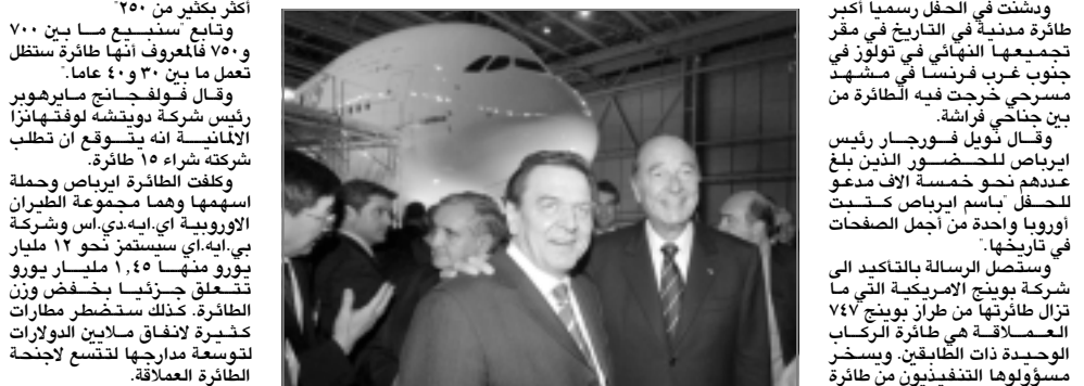
أكثر ويشت في الحفل رسميا أكبر طائرة مدنية في التاريخ في مقر تجميعها النهائي في تولوز في جنوب غرب فرنسا في مشهد مسرحي خرجت فيه الطائرة من بين جناح فرأشه. وقال نويل فورجر رئيس إيرباص للحضور الذين بلغ عددهم نحو خمسة الاف مدعو للحفل باسم إيرباص كحدث أوروبا واحدة من أجمل الصفحات في تاريخها. ويستقبل الرسالة بالتحديد الى شركة بوينغ الامريكى التي ما تزال طائرتها من طراز بوينغ ٧٤٧ العملاقة هي طائرة الركاب الوحيدة ذات الطابقين. ويسخر مسؤولوها التنفيذيون من طائرة

نويل فورجر الجديدة ويطلقون عليها اسم "سفينة نويل" على غرار "سفينة نوح" . وتتسع الطائرة العملاقة ايه-٣٨٠ لنحو ٧٠٠ سياره يمكن ان تصطف على جناحها وتشبه ٧٤٧ لكن قسمها العلوي يمتد حتى الذيل، وخصصت لشركات الطيران نحو ٤٠ مليار دولار لشراء الطائرة الجديدة ذات الطابقين التي تسع ٥٥٥ مقعدا متوقعة ان تخفف تكاليف التشغيل وتدعم الازدياد التي خفضها ارتفاع أسعار النفط وتباطؤ حركة الطيران والسياحة العالمية منذ عام ٢٠٠١م. وقال روبرت نوتال نائب الرئيس للتسويق في شركة رولز-رويس صانعة محركات الطائرة نويل فورجر الجديدة ويطلقون عليها اسم "سفينة نويل" على غرار "سفينة نوح" . وتتسع الطائرة العملاقة ايه-٣٨٠ لنحو ٧٠٠ سياره يمكن ان تصطف على جناحها وتشبه ٧٤٧ لكن قسمها العلوي يمتد حتى الذيل، وخصصت لشركات الطيران نحو ٤٠ مليار دولار لشراء الطائرة الجديدة ذات الطابقين التي تسع ٥٥٥ مقعدا متوقعة ان تخفف تكاليف التشغيل وتدعم الازدياد التي خفضها ارتفاع أسعار النفط وتباطؤ حركة الطيران والسياحة العالمية منذ عام ٢٠٠١م. وقال روبرت نوتال نائب الرئيس للتسويق في شركة رولز-رويس صانعة محركات الطائرة