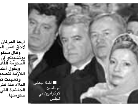
لقطة لبعض البرلمانيين الأوكرانيين في الجلسة

كما ستوجه رايس إلى إسرائيل والصفة الغربية وهي متفائلة إزاء الفرصة الجديدة التي لاحت لعملية