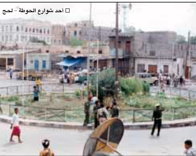
□ أحد شوارع الحوطة - لحج

في إطار التوجه العام سنقوم بدعم الشباب وتحسين أوضاعهم