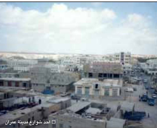
□ احد شوارع مدينة عمران

وليس لهم حاجة الانتظار في قوائم طلب الحصول على الوظيفة.