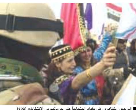
■ الزيدون يتظاهرون في بغداد احتجاجاً على حرماتهم من الانتخابات

■ بغداد/وكالات: بدأ المزايمك الطائفي والعرقى طاغيا على المشهد العراقي وطالبت المرجعية الشيعية جعل الإسلام المصدر الوحيد، التشريع في الدستور الدائم، وهددت احزاب تمثل مليون مسيحي باللجوء الى المحاكم الدولية للاحتجاج على «حرماتهم» من التصويت في قرى سهل محافظة نينوى. ولم يكن العرب والتركمان في كركوك أقل غضباً على الانتخابات وحذروا من ضم الأكراد للمدينة. وقالت المرجعية الشيعية في بيان أن «العلماء والمراجع كافة ومعظم الشعب العراقي المسلم مطالبون الدولة والمجلس الوطني بقوة أن يكون الإسلام في الدستور الدائم للعراق المصدر الوحيد للتشريع في العراق ورفض أي بند ي تشريع من الدستور الدائم اذا كان مخالفاً للإسلام. وبعد ان أكدت ان هذا الأمر «غير قابل للمساومة»، حذرت المرجعية الشيعية من «تغيير وجه العراق وفصل الدين عن الدولة» فإن في ذلك مخاطرة لا تحمد عقبها، وذلك مرفوض لدى العلماء والمراجع كافة. وقال مصدر قريب من المرجع الشيعي البارز