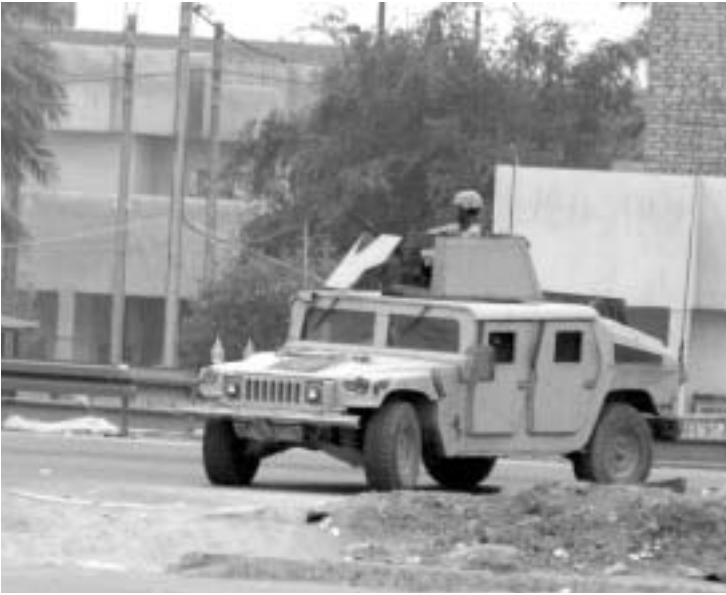
الاکراد يقتربون من رئاسة الجمهورية؛