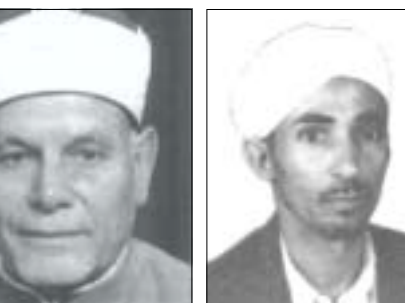
.. فضيلة الشيخ / عطية بن ص

عشرة آلاف نسمة. ليس هذا ما يدل على أن هناك جهنم طبيعية تنتهب تحت بحارنا الزرقاء ومدننا الحضارية المكتظة بالسكان، ونحن واقفون على ظهر لغم أو ديناميت فتلعب يوشك أن ينفجر فجأة فيدمر النظام الإجمالي بأكمله.