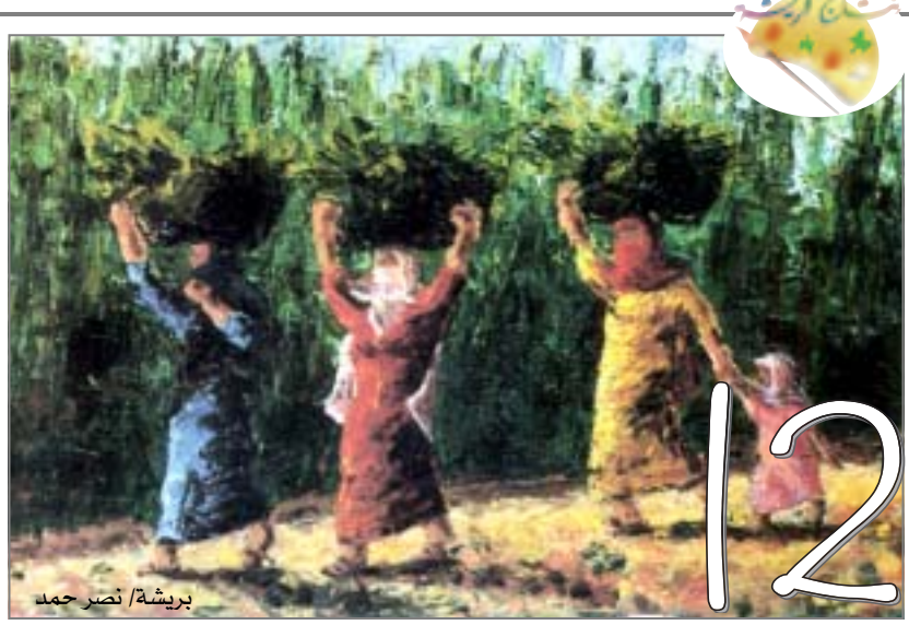
بريشة / تصر حمد