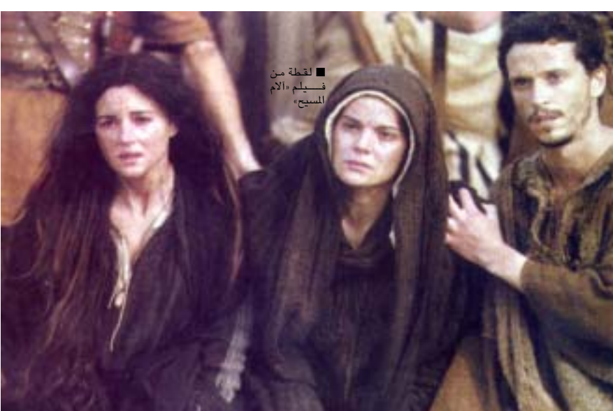
لقطة من فيلم «الأم المسيح»