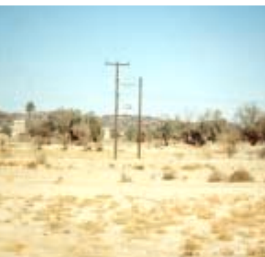
شبكة كهرباء كتاف البقع

وعموماً نتطلع إلى واقع تنموي أفضل خلال السنوات المقبلة سعداء بما تحقق وتم إنجازته في مختلف مجالات التنمية في هذه المناطق خلال الفترة الماضية.