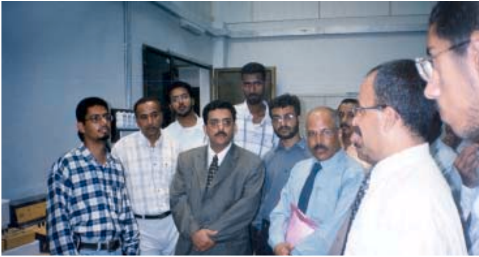
زيارة وزير التعليم الفني للمعاهد حضرموت