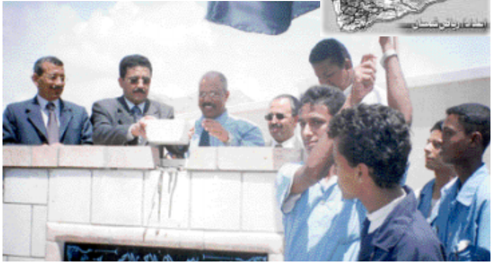
الوزير يضع حجر الأساس لمعهد في الشحر