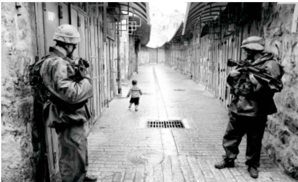
جنديان إسرائيليان يراقبان طفلاً فلسطينياً أخطرق حظر التجول أمس بالضفة «عما»

وتطالب الولايات المتحدة إسرائيل بالانسحاب تاماً من جميع المواقع الاستيطانية التي بنتها منذ مارس عام ٢٠٠١م، وكان رئيس الوزراء الإسرائيلي ارئيل شارون قد اعلن العام الماضي عن خطة للانسحاب من غزة وعدد من مستوطنات الضفة الغربية من جانب واحد.