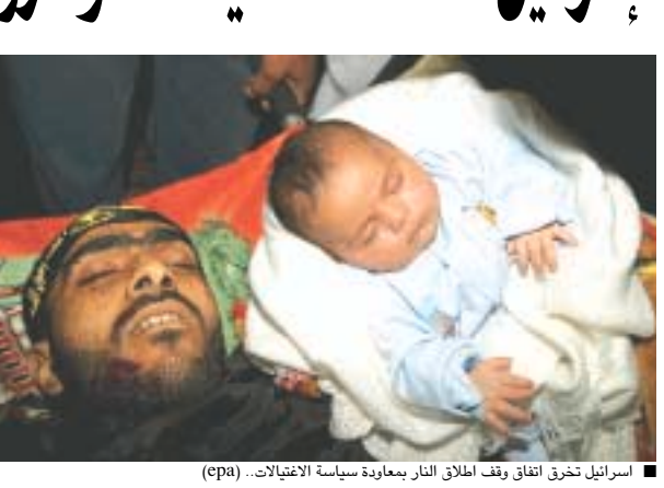
■ إسرائيل تحرق اتفاق وقف إطلاق النار بعبادة سياسة الاغتيالات.

■ رام الله/ وكالات/.. اغتالت القوات الإسرائيلية مقاومة من حركة الجهاد الإسلامي تزعم أن له صلة بتفجير تل أبيب الشهر الماضي خلال غارة قامت بها في الضفة الغربية أمس رغم اتفاق وقف إطلاق النار. وقال الرئيس الفلسطيني محمود عباس في غزة كما هو مطلوب منا التهديد .. مطلوب من إسرائيل أن لا تقوم بعمل هذه الأعمال . ووصف وزير فلسطيني الحيات بأنه عملية اغتيال وقال أنه قد يؤدي إلى مزيد من العنف. وجاءت العملية الإسرائيلية في الوقت الذي تسلم فيه الجنرال الأمريكي وليام وورد مهامه رسمياً وكان قد عين في فبراير الماضي منسقا خاصا لمساعدة الفلسطينيين في المجال الأمني. وقد وصل الجنرال وورد الأربعاء إلى المنطقة. وسبق أن أجرى سلسلة محادثات في الأسابيع الماضية مع مسؤولين إسرائيليين