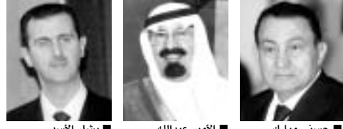
حسني مبارك ■ الأمير عبدالله ■ بشار الأسد

عبدالله يلبي بذلك دعوة قديمة من الرئيس شيراك الذي سيبحث معه - أيضا - تطورات الوضع في الشرق الأوسط وفي لبنان . وتابع : إن ولي العهد السعودي سيبحث الموقف الإيجابي للرئيس السوري بشار الأسد بشأن سحب قوات بلاده من لبنان، إلا أن وزارة الخارجية السعودية نفت وجود وساطة للملكة بشأن الوضع في لبنان . وصرح مصدر سعودي مسؤول لوكالة الأنباء السعودية بان الخبر الذي تناقلته بعض وسائل الإعلام عن وجود وساطة سعودية بشأن الوضع في لبنان عار تماما من الصحة، مؤكدا أنه لم يطلب من الملكة أية وساطة في هذا الشأن، كما أن الملكة لم تعرض ذلك .