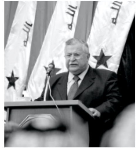
جلال الطالباني، الرئيس المنتخب للعراق.