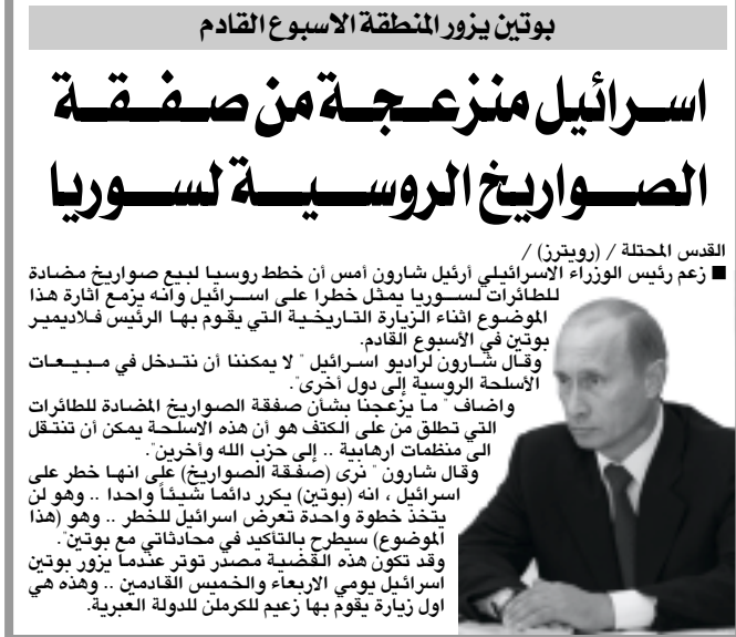
بوتين يزور المنطقة الأسبوع القادم

كما أشار مجدداً إلى إمكانية تأجيل البدء بتنفيذ الخطة ثلاثة أسابيع بعد التاريخ المقرر لذلك في ٢٠ يوليو القادم تحت دعاوى تتعلق بالحساسيات الدينية لدى المستوطنين اليهود، وقال أن ذلك لن يغير شيئاً في الخطة حسب زعمه. كما انتقد بشدة الحاخامات الذين يدعون الجنود والشرطة إلى عدم الانصياع إلى