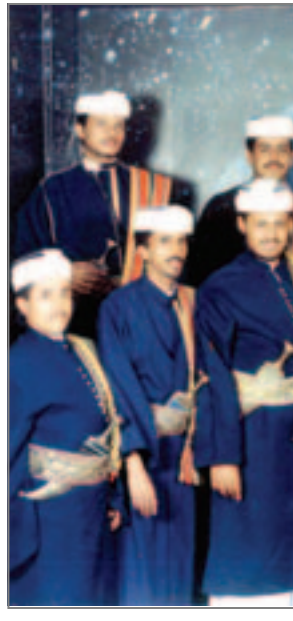
تعود إلى جمعية المنشدين ما الذي قدمته لكم؟

بما أنك تجد أداء الإحسان الشامية والعربية هل تشارك في إحياء حفلات جالباتهم في اليمن؟ أقيمت عدة حفلات أعراس لسورين وأرنبين في بلادنا ويصاحب تقديمي للأنشيد الشامية تأتي بالنشيد الصناعي ولكن بشكل يناسب وضوح الكلمات ويستطيع الجمهور فهمه بسرعة، ولقد شعرت في هذه الحفلات أن اللحن اليمني مرغوب ولكنه يحتاج إلى أداء جيد ومناسب.