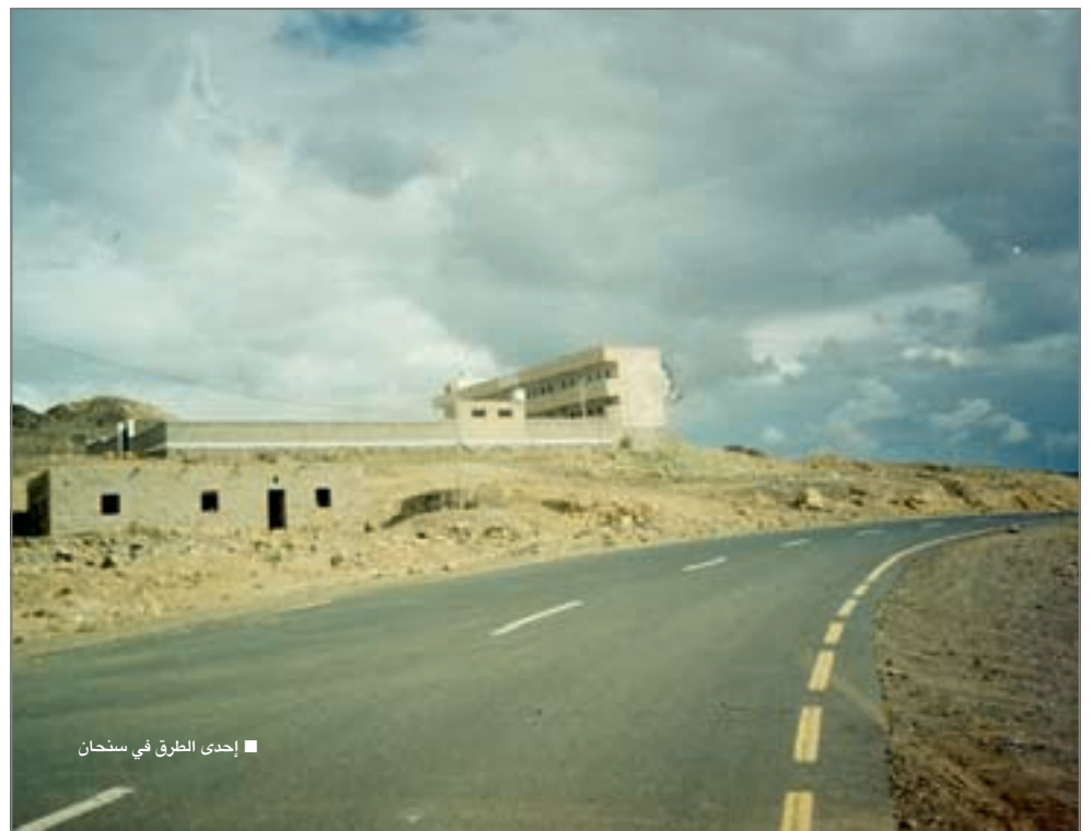
■ إحدى الطرق في سنحان