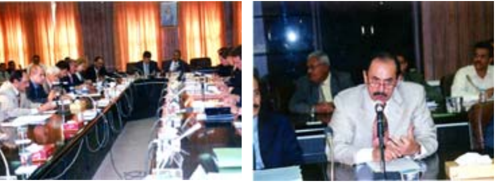
في جلسة المشاورات اليمنية - الألمانية :