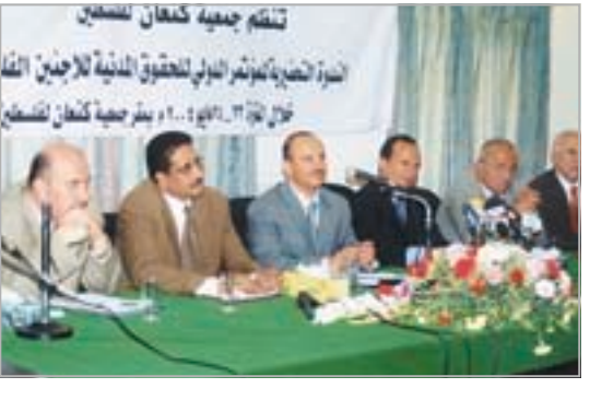
الندوة التحضيرية للمؤتمر الدولي لحقوق اللاجئين الفلسطينيين

ومتساوية مع مواطنيها. الى ذلك رفع المشاركون في الندوة برقية شكر وتقدير لفخامة الأخ علي عبدالله صالح رئيس الجمهورية والحكومة اليمنية لانحسان المدرسين والندوة والمؤتمر والتهنئة الحارة للشعب اليمني وقيادته السياسية بمناسبة العيد الوطني الخامس عشر للجمهورية اليمنية. وكان الدكتور عبدالوهاب راوح وزير التعليم العالي والبحث العلمي والدكتور عبدالسلام محمد الجوفي وزير التربية والتعليم قد استعرضا أوضاع الطلاب والمدرسين الفلسطينيين في اليمن وتوجهات القيادة السياسية ممثلة بفخامة الأخ علي عبدالله صالح رئيس الجمهورية بتسهيل كافة المعاملات والمهام للاخوة الفلسطينيين سواء في مجال التعليم العالي والجامعات اليمنية