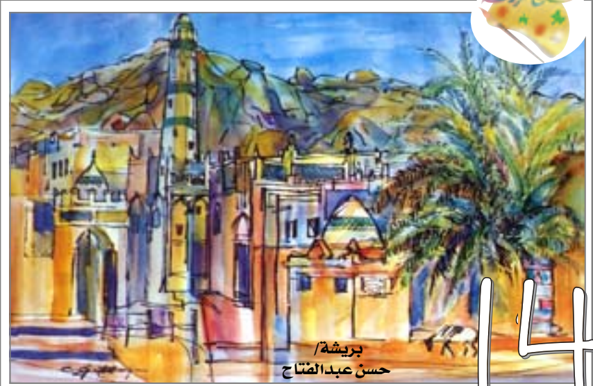
بريشة/ حسن عبدالفتاح

الأحد ٢٠ ربيع ثاني ١٤٢٦هـ الموافق ٢٩ مايو ٢٠٠٥ العدد (١٤٨٩)