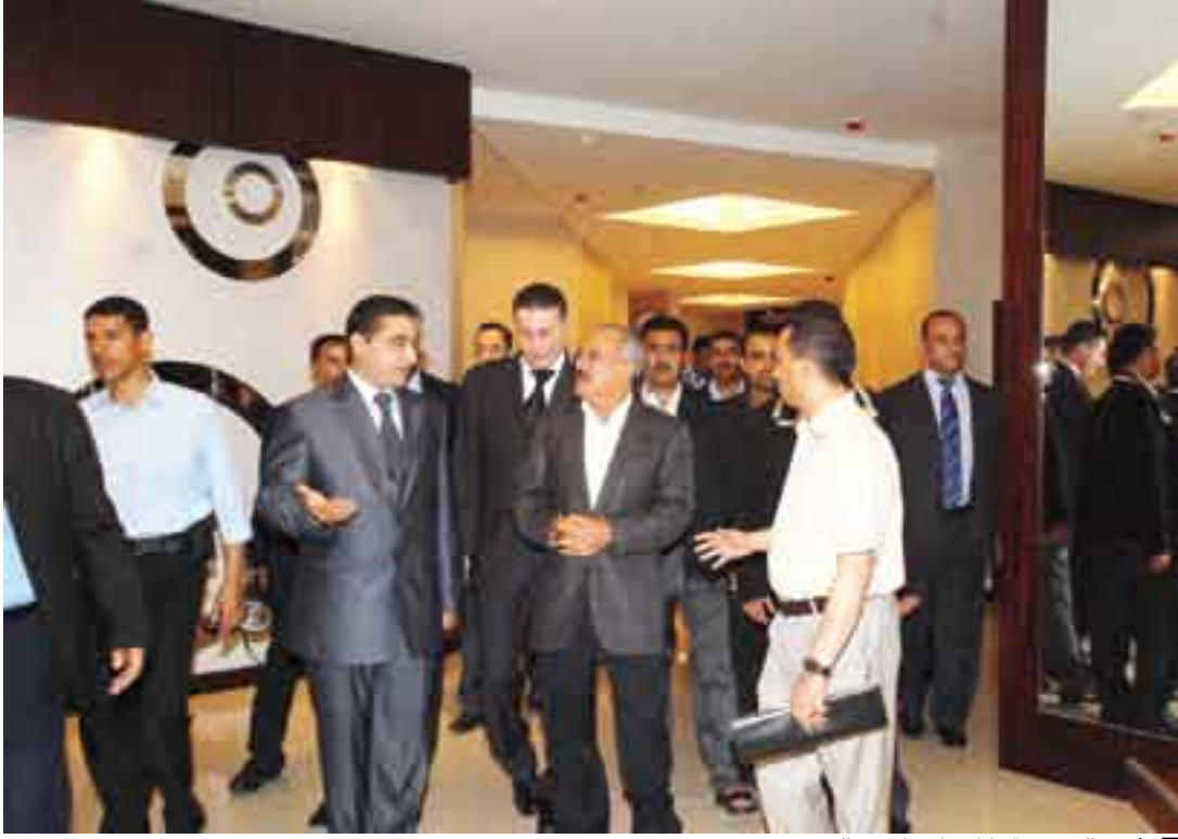
رئيس الجمهورية خلال زيارته لمجمع القصر في عدن..

ماتم إنجازاه لم يقتصر على المرافق الرياضية والفندقية بل شمل مختلف مشاريع البنية التحتية